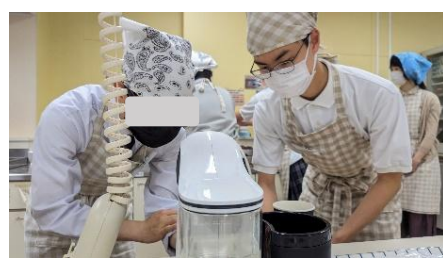
↑ドリップマシンでコーヒーを淹れる様子