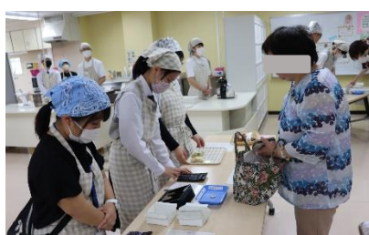
↑会計係、接客の様子