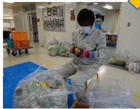
分別・ラベルはがし