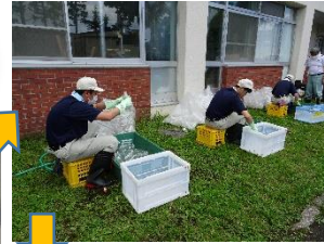
ペットボトル洗い